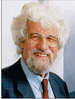
Hans Peter Dürr, Schirmherr